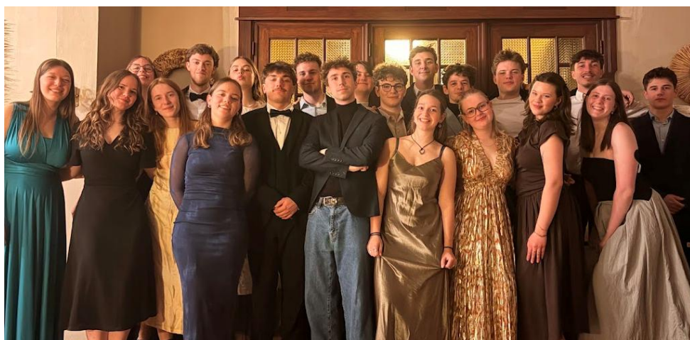
Groetjes vanop Leidingsweekend!

Datum: 20/04/2026 – 3/05/2026, 60 ste jaargang, nr. 16 Verschijnt 2 maal per maand (maar niet in juli en augustus)