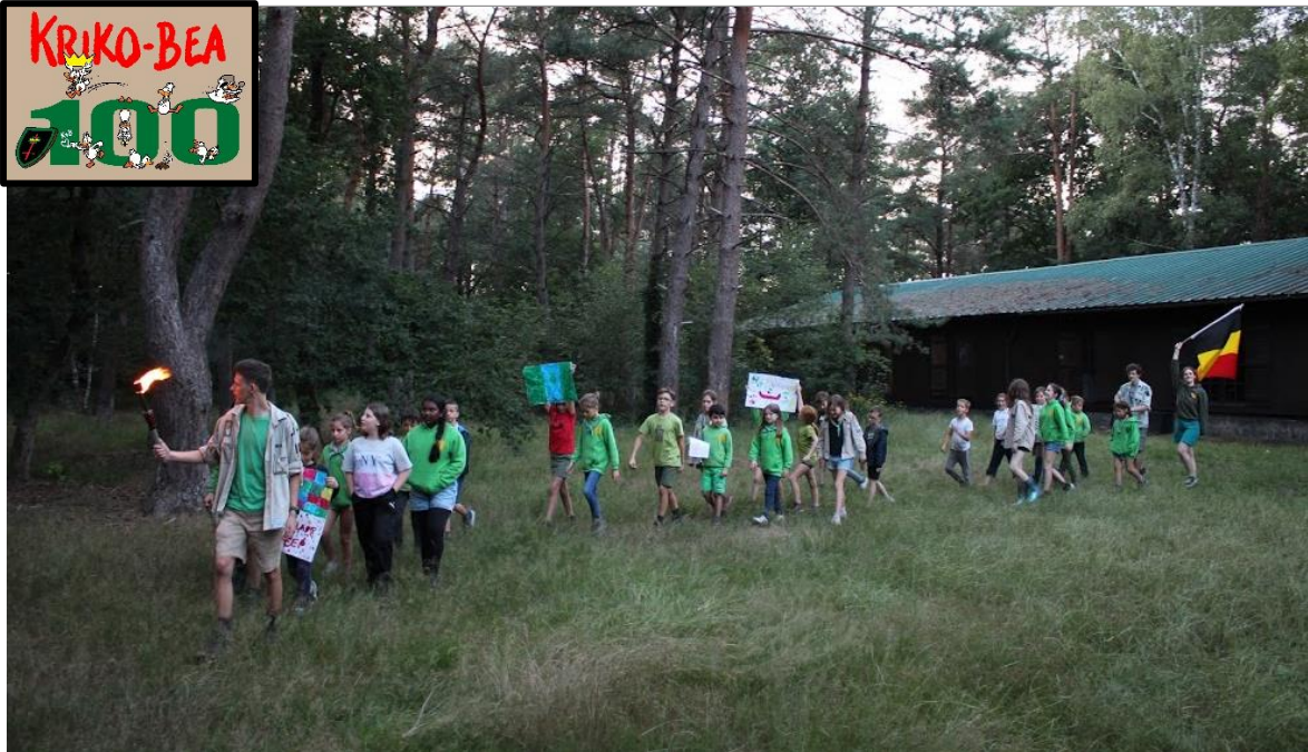
Olympische stoet op welpenkamp, 2020

Datum: 3/05/2021 - , 55 ste jaargang, nr. 18 Verschijnt 2 maal per maand (maar niet in juli en augustus)