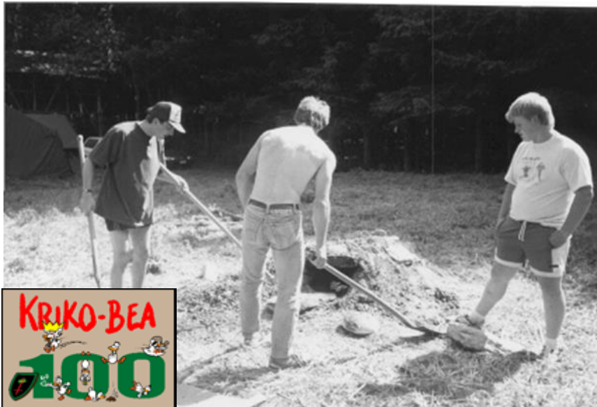
Givers bakken brood in zelfgemaakte oven. Giverkamp, Brisyl, juli 1989.

Datum: 22/03/2021 – 05/04/2021, 55 ste jaargang, nr. 15 Verschijnt 2 maal per maand (maar niet in juli en augustus)