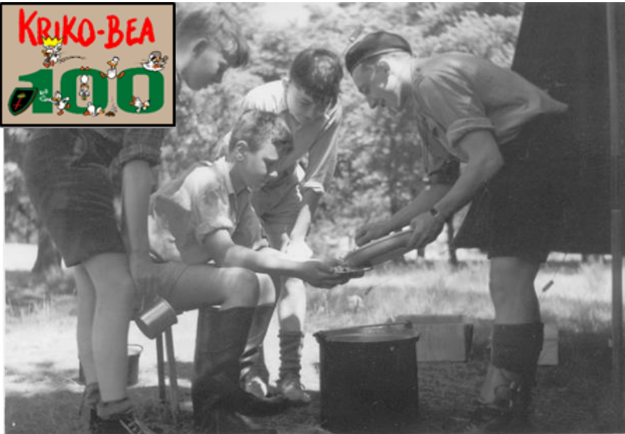
Jongverkennerkamp in 1953 te Zonhoven.

Datum: 28/12/2020 – 11/01/2021, 55 ste jaargang, nr. 9 Verschijnt 2 maal per maand (maar niet in juli en augustus)