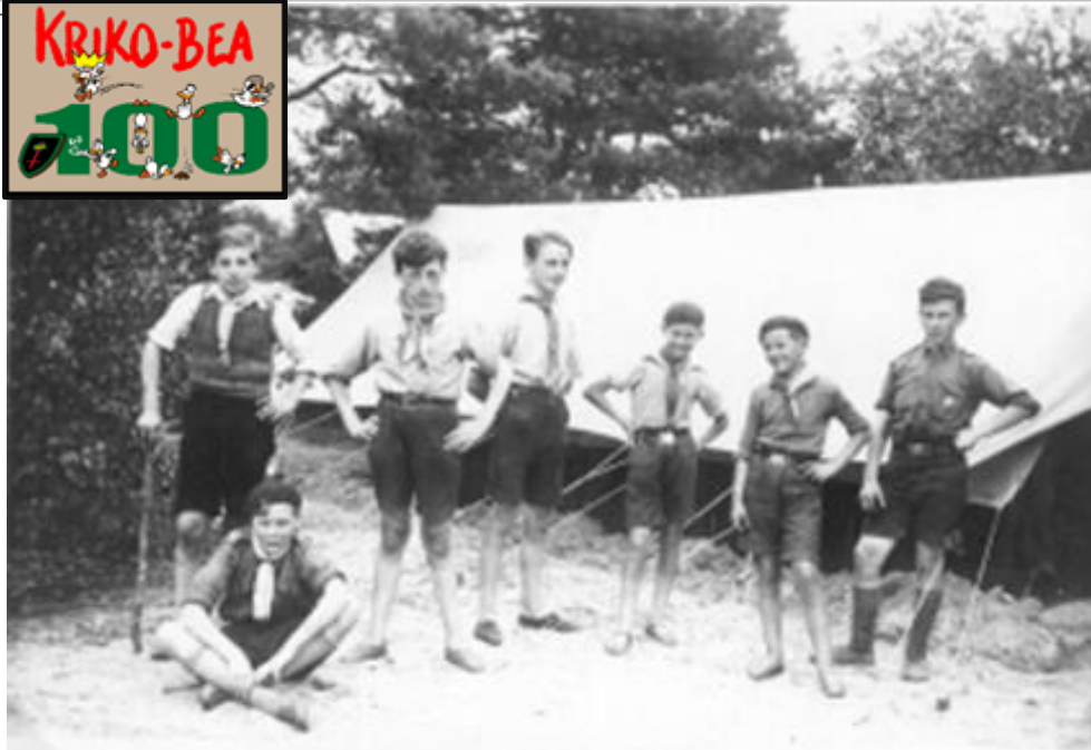
Kamp Mol 1936.

Datum: 16/11/2020 – 30/11/2020, 55 ste jaargang, nr. 5 Verschijnt 2 maal per maand (maar niet in juli en augustus)