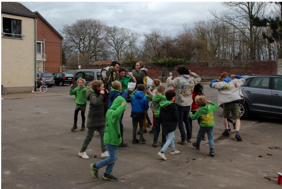
De Kapoenen oefenen een laatste keer hun dansje voor het groepsfeest

Datum: 02/03/2020 – 16/03/2020, 54 ste jaargang, nr. 14 Verschijnt 2 maal per maand (maar niet in juli en augustus)