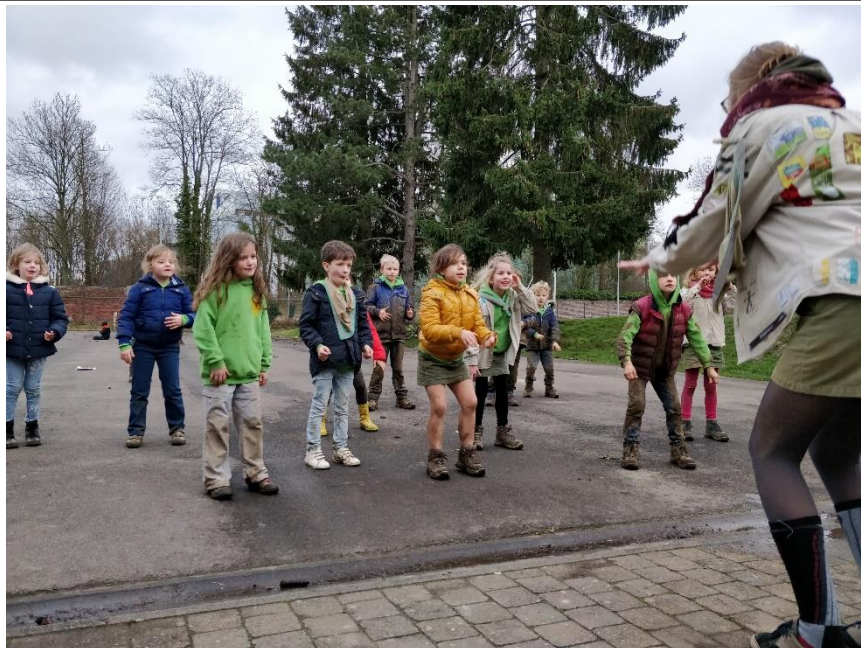
De kapoenen oefenen hun dansje voor het groepsfeest!

Datum: 03/02/2020 – 17/02/2020, 54 ste jaargang, nr. 12 Verschijnt 2 maal per maand (maar niet in juli en augustus)