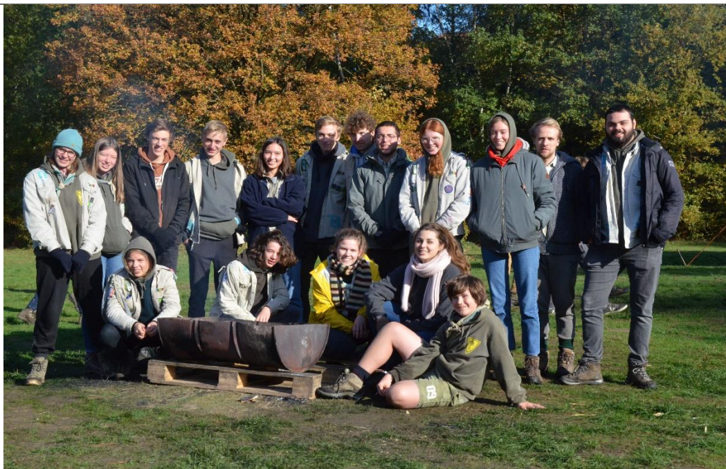
Givers, jin en hun leiding op de Erikatocht

Datum: 25/11/2019 – 9/11/2019, 54 ste jaargang, nr. 7 Verschijnt 2 maal per maand (maar niet in juli en augustus)