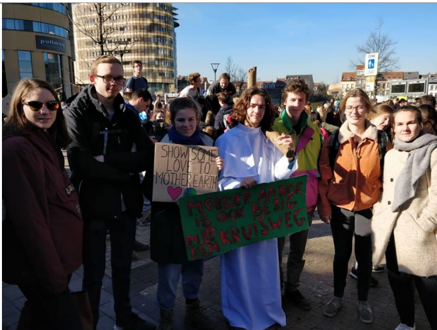
Aanwezig op de klimaatmars!

Datum: 18/02/2019 – 04/03/2019, 53 ste jaargang, nr. 13 Verschijnt 2 maal per maand (maar niet in juli en augustus)