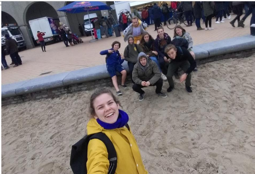
Deze dappere givers hebben zich dit weekend aan de nieuwjaarsduik gewaagd

Datum: 7/01/2019 – 01/10/2018, 53 ste jaargang, nr. 10 Verschijnt 2 maal per maand (maar niet in juli en augustus)