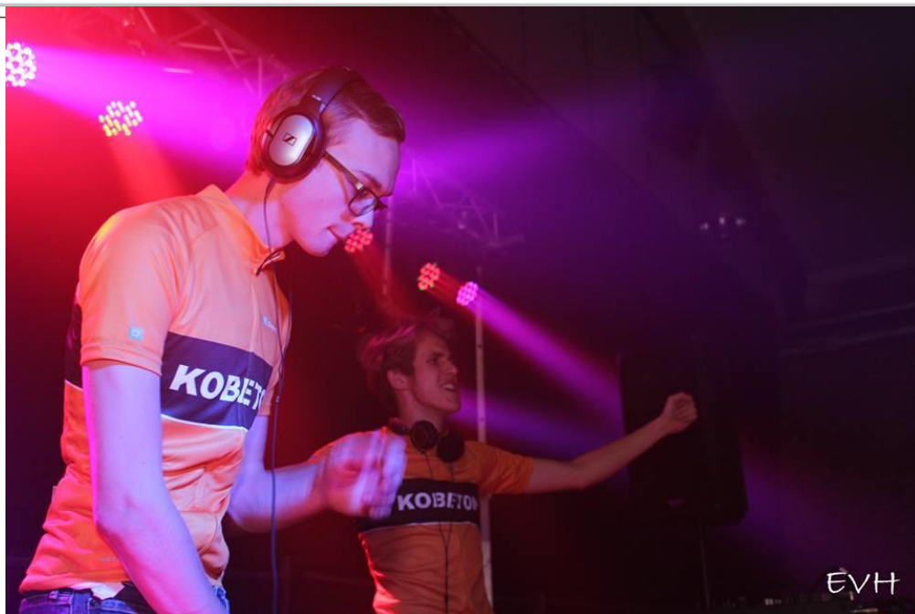
Onze eigen Kobeton was een groot succes op de Halloweenfuif

Datum: 29/10/2018 – 12/11/2018, 53 ste jaargang, nr. 5 Verschijnt 2 maal per maand (maar niet in juli en augustus)